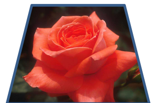
花公園からいただいた きれいなバラが咲きました