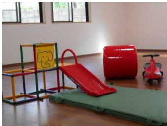
プレイルーム・ホール

まずは、子供たちが安心して楽しく遊び、食べ、排泄出来ることを目標にやっていきます。子供達一人ひとりと丁寧に寄り添いながら、自分でできることを増やし、課題を通し達成感や満足感を味わい、わからない時や困った時に助けを求めたり、